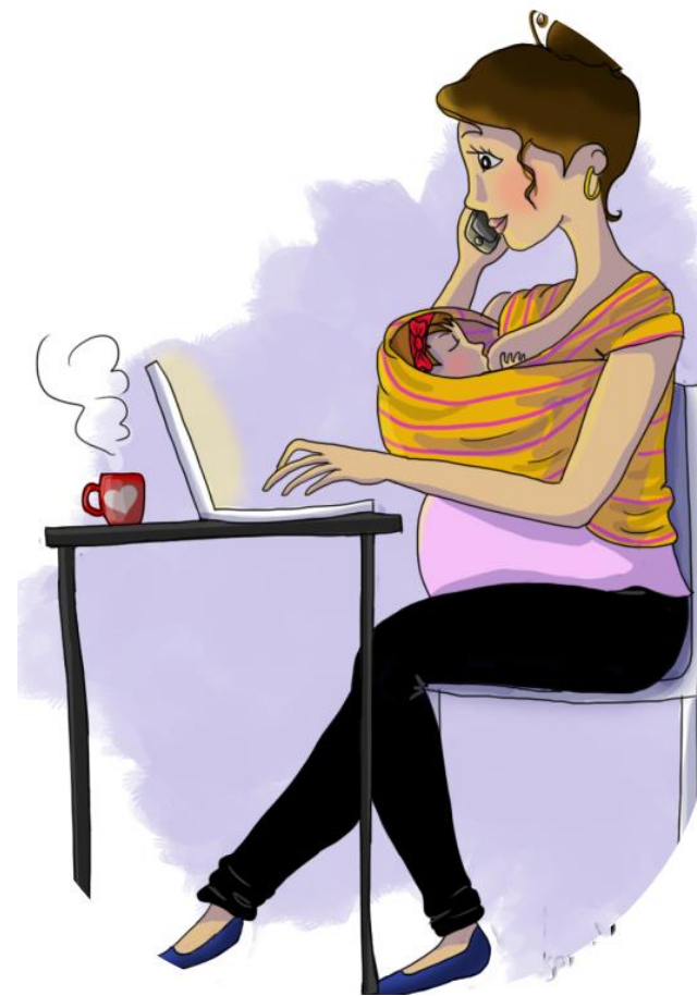
Να εργαστεί στον υπολογιστή