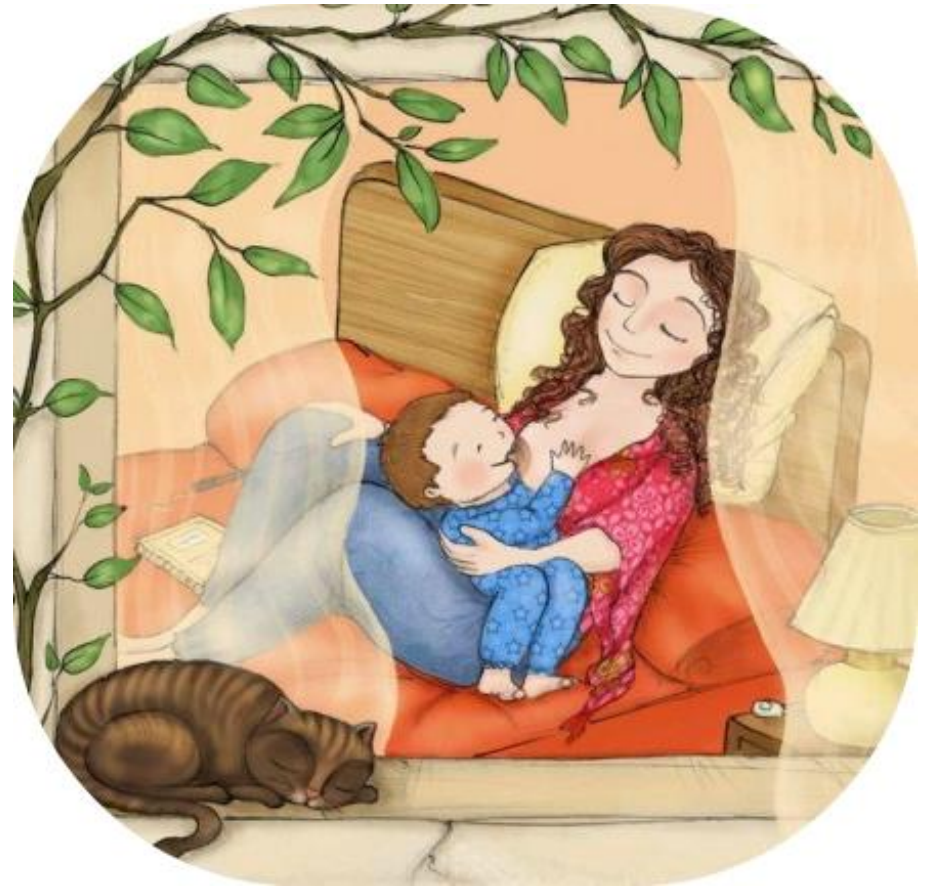
Sleep and rest at the end of the day