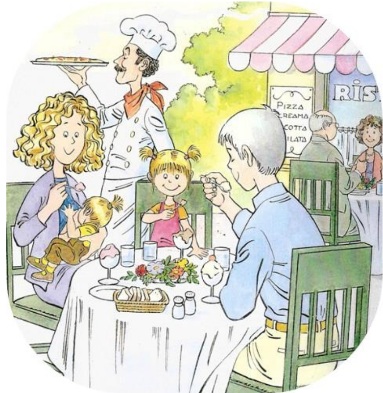
Eat some yummy ice cream