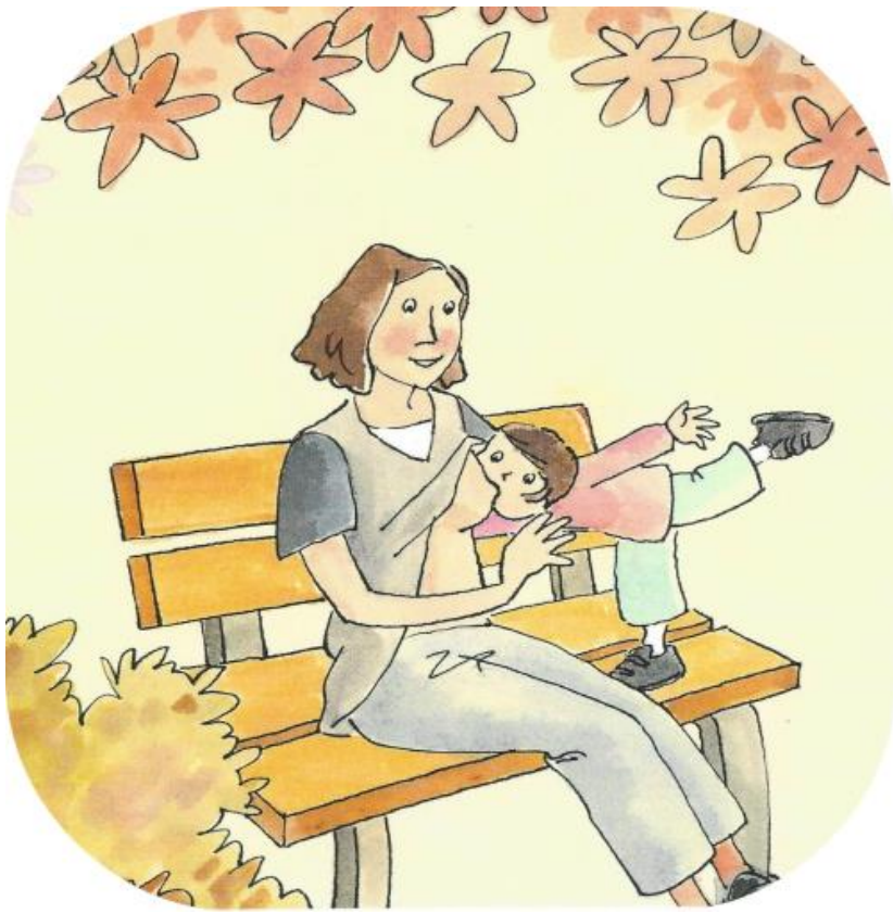
Go to the park