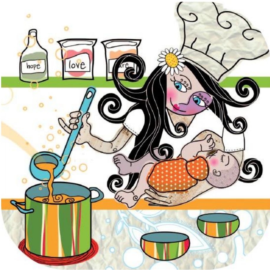
Cook some delicious home made baby food