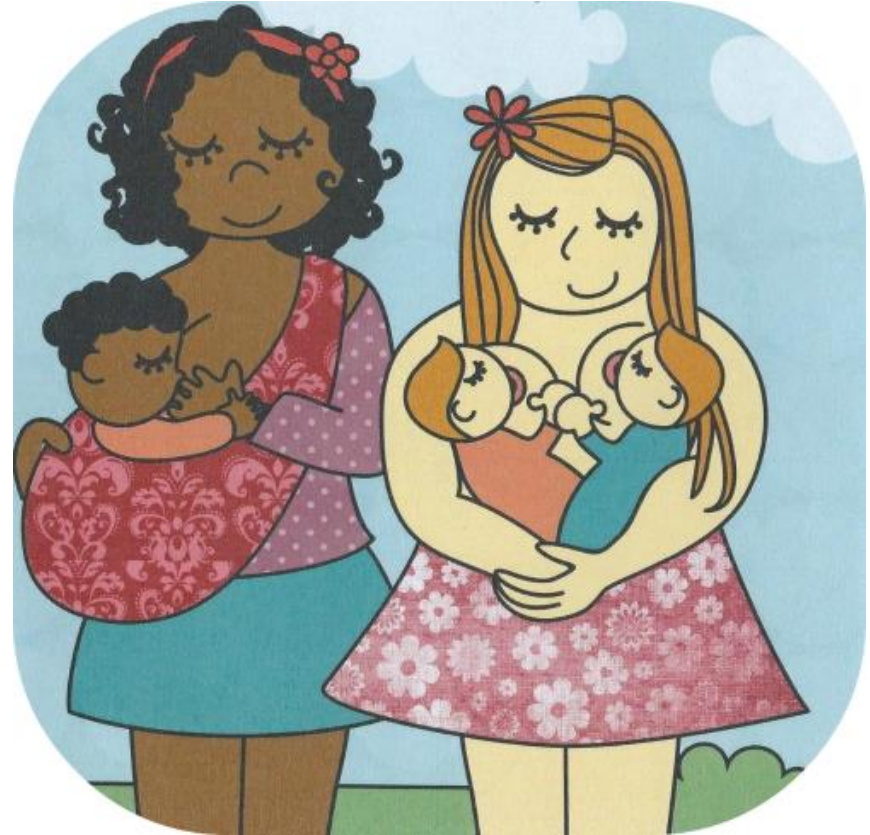
Meet with other breastfeeding mothers